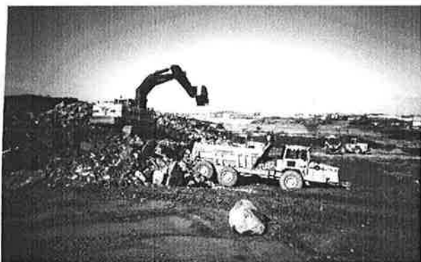
Aktiviteten er på topp på Baker's