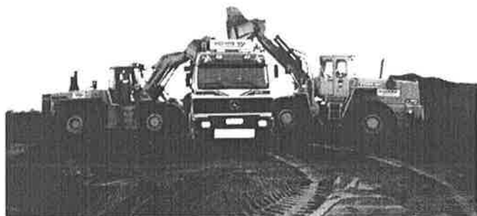
Lasting på Sele