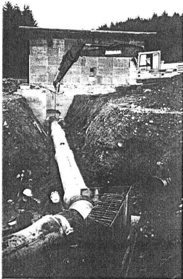
Arbeidet har vært krevende med korte tidsfrister og stenging av vann.