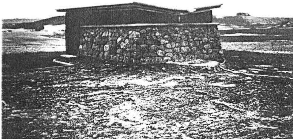
Kåre Vatland og Erling Sola har utført et flott håndverksmessig arbeid med steinløyng rundt ventilkammerne. Bildet viser Skjæveland ventilkammer.