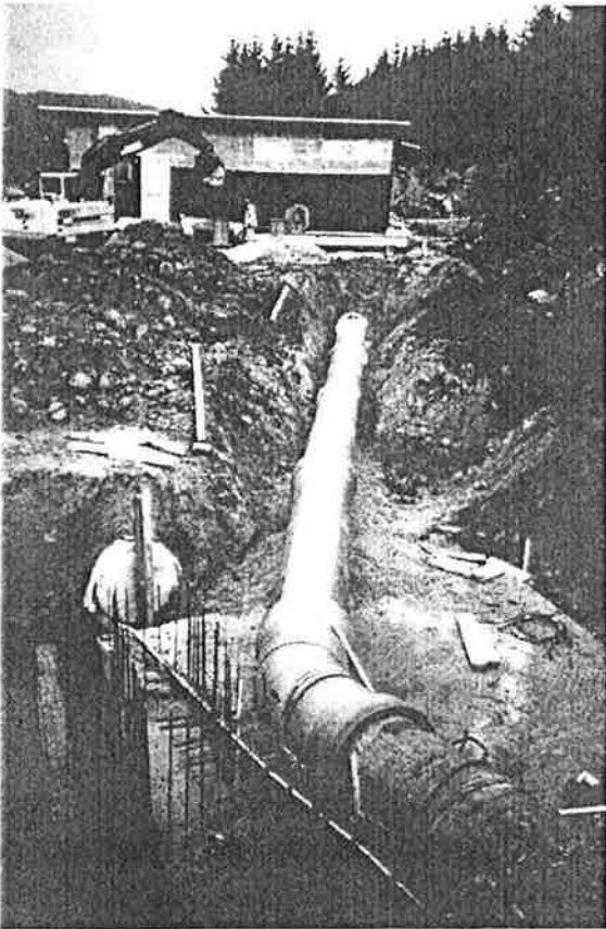
Gudmund, Jørgen og Torger har hatt en traveltid med kobling av de forskjellige ventilkammer.