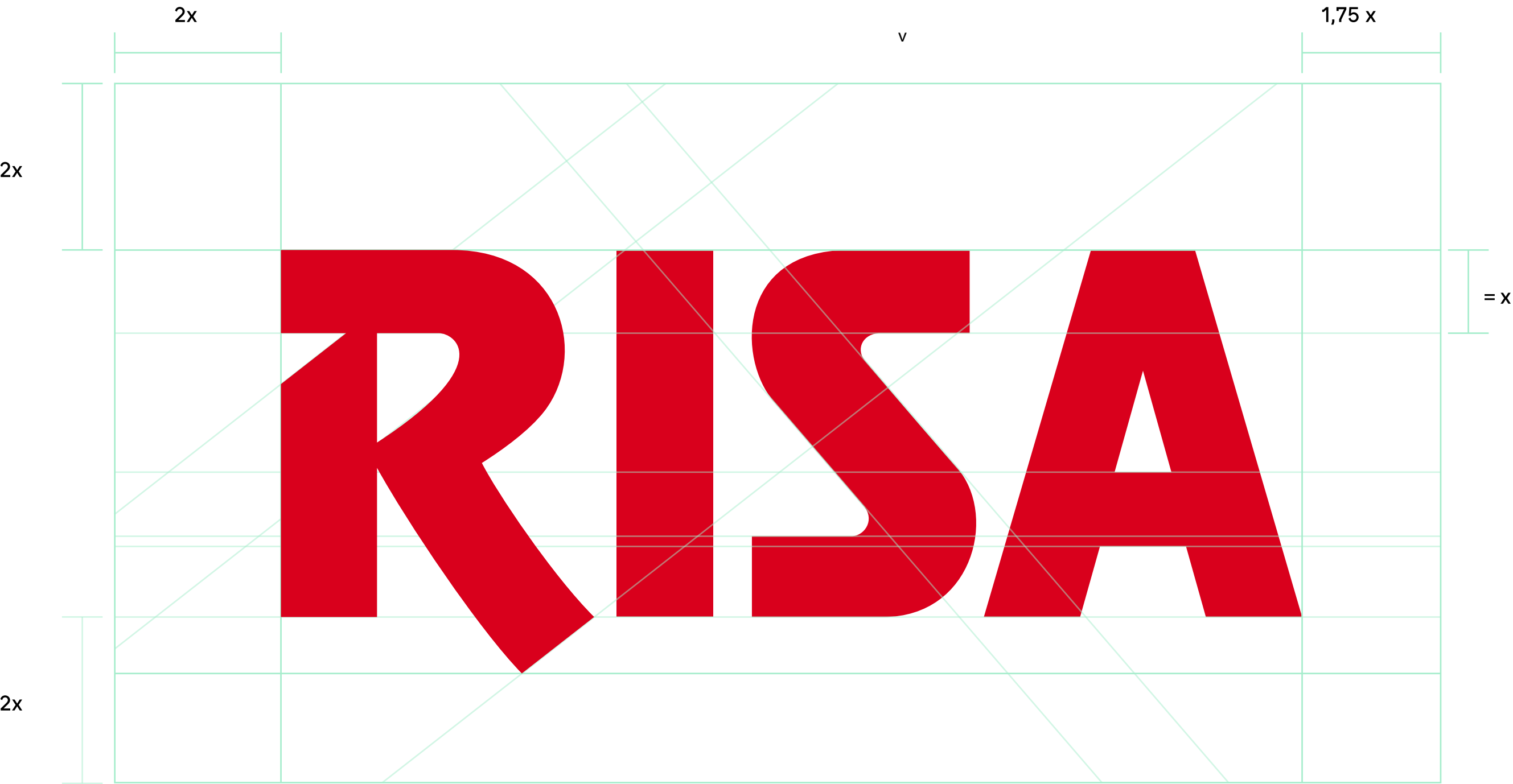
Navnetrekk - Hovedlogo